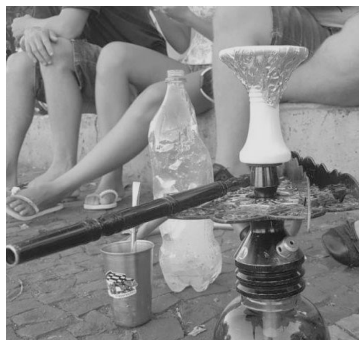
Apesar de parecer inofensivo, narguilé é altamente perigoso

Vale lembrar que conforme a Organização Mundial da Saúde (OMS), uma hora de sessão de narguilé equivale a fumar cem cigarros comuns, sendo um produto altamente cancerígeno.